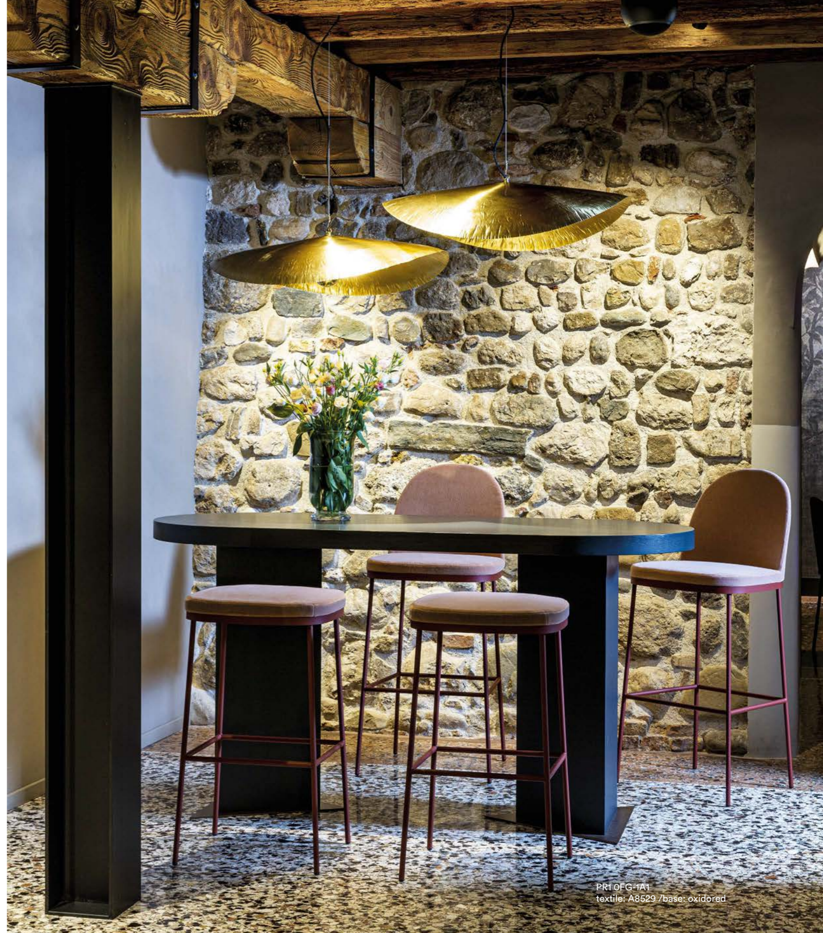
PR1 OFG-1A1 textile: A8529 / base: oxidored