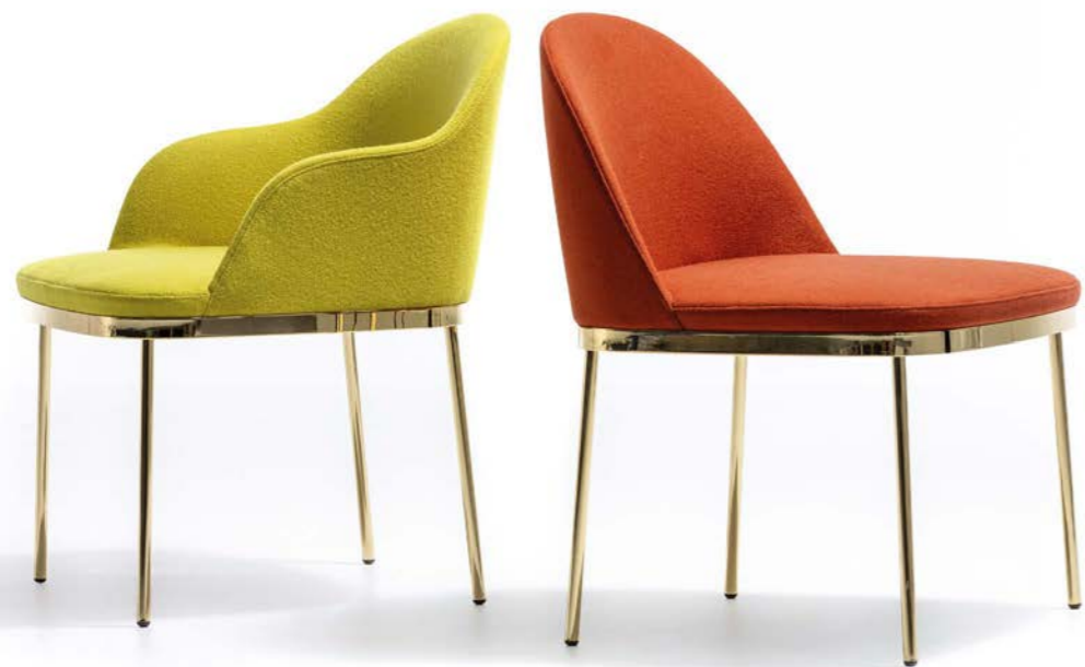
code: PR10PU-ONU textile: A8310, A0903 base: gold chrome