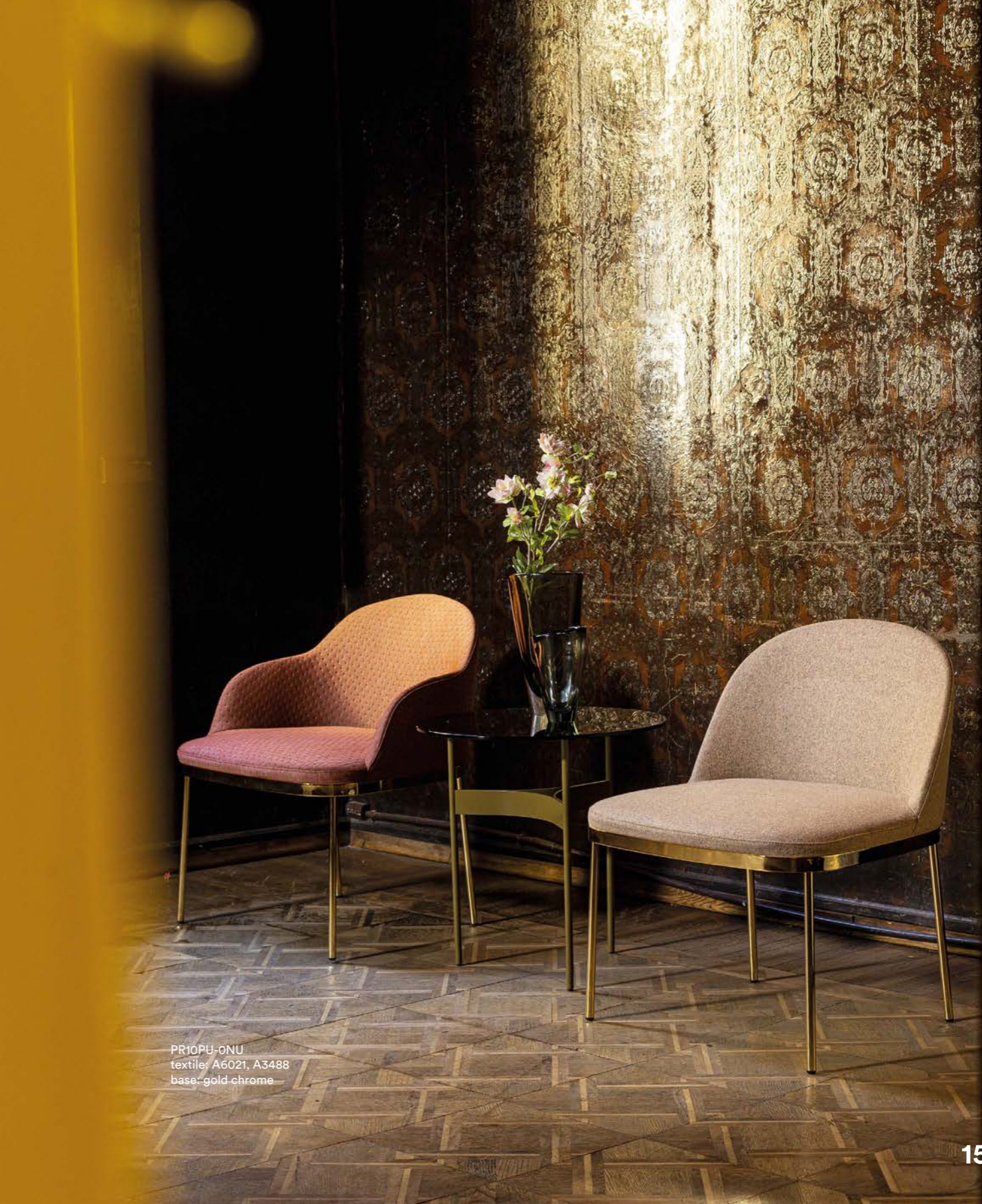
PR10PU-ONU textile: A6021, A3488 base: gold chrome