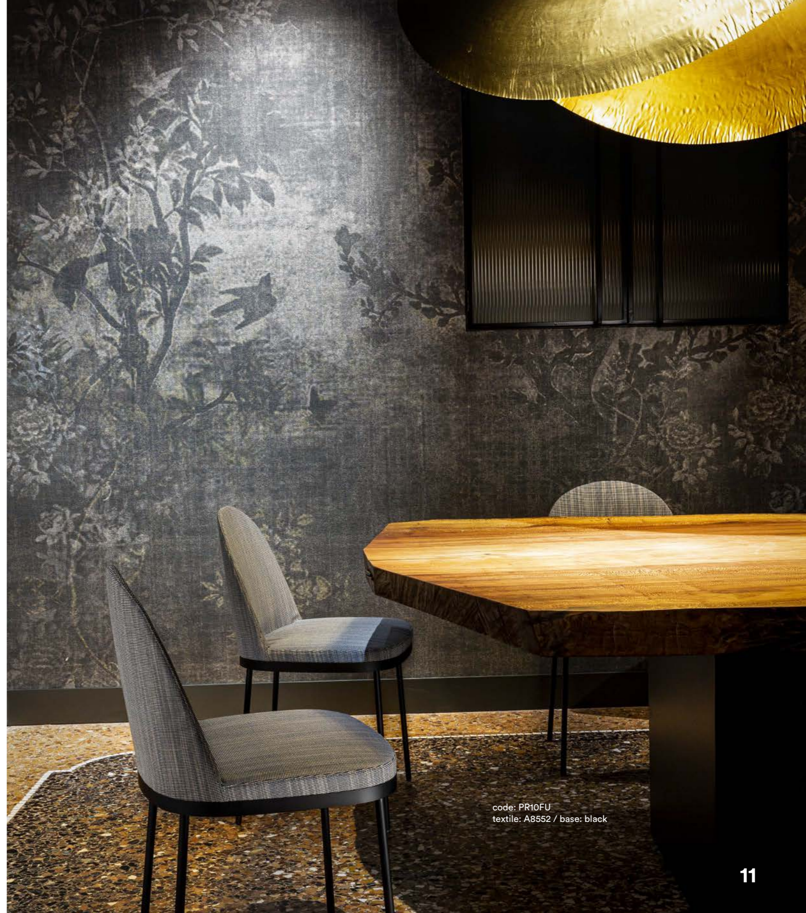
code: PR10FU textile: A8552 / base: black