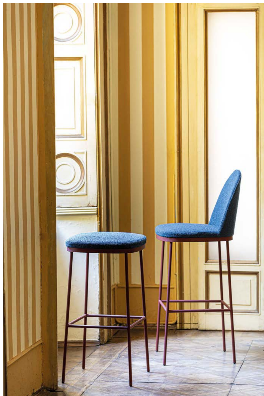
PR1 OFG-1A1 textile: A8843 / base oxidored