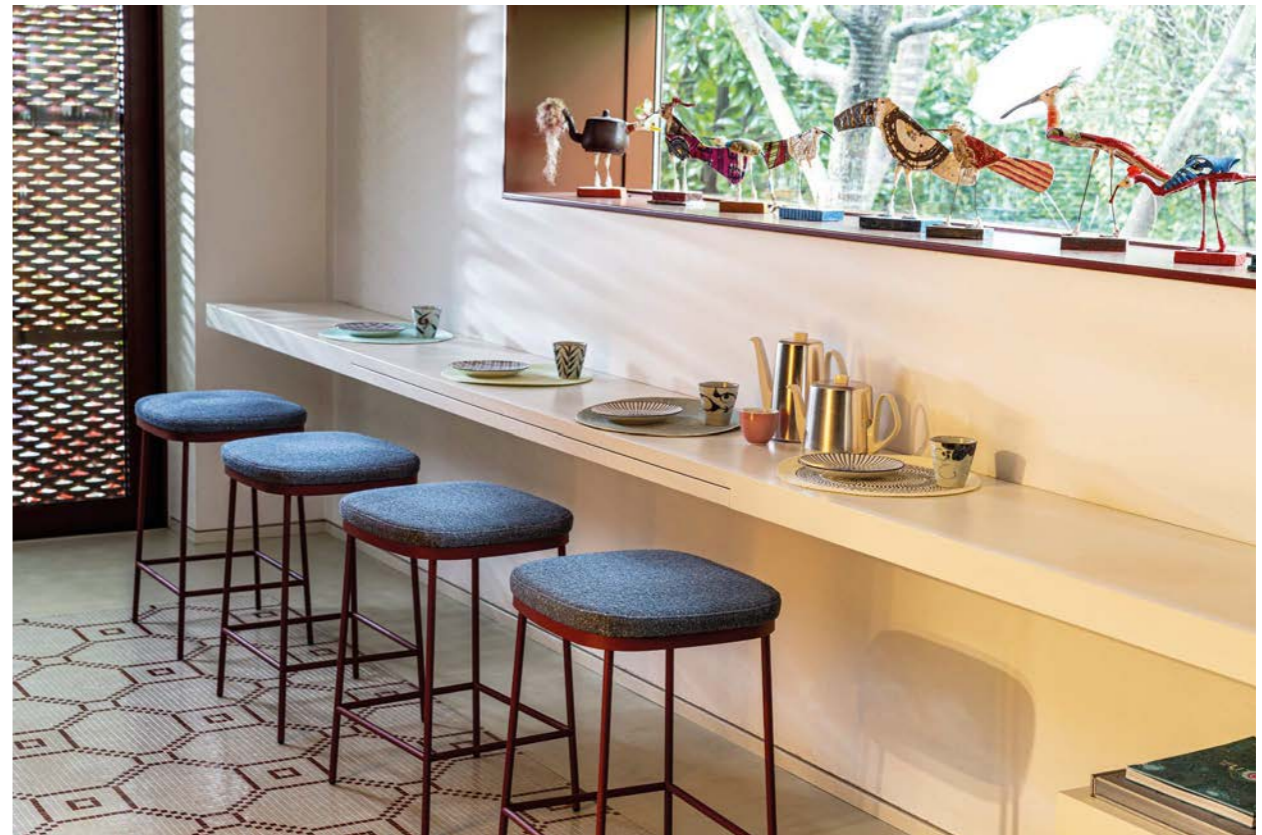
PR1 1A4 textile: A8843 / base oxidored