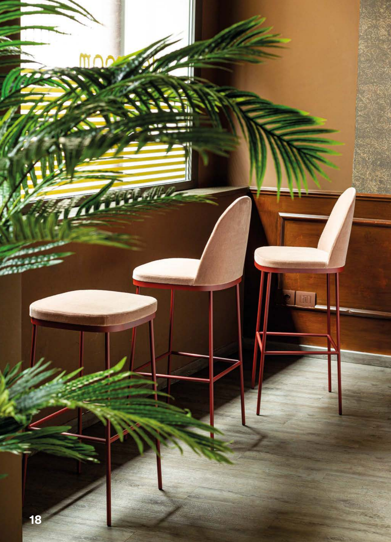
PR1 0FG-1A1 textile: A8529 / base oxidored